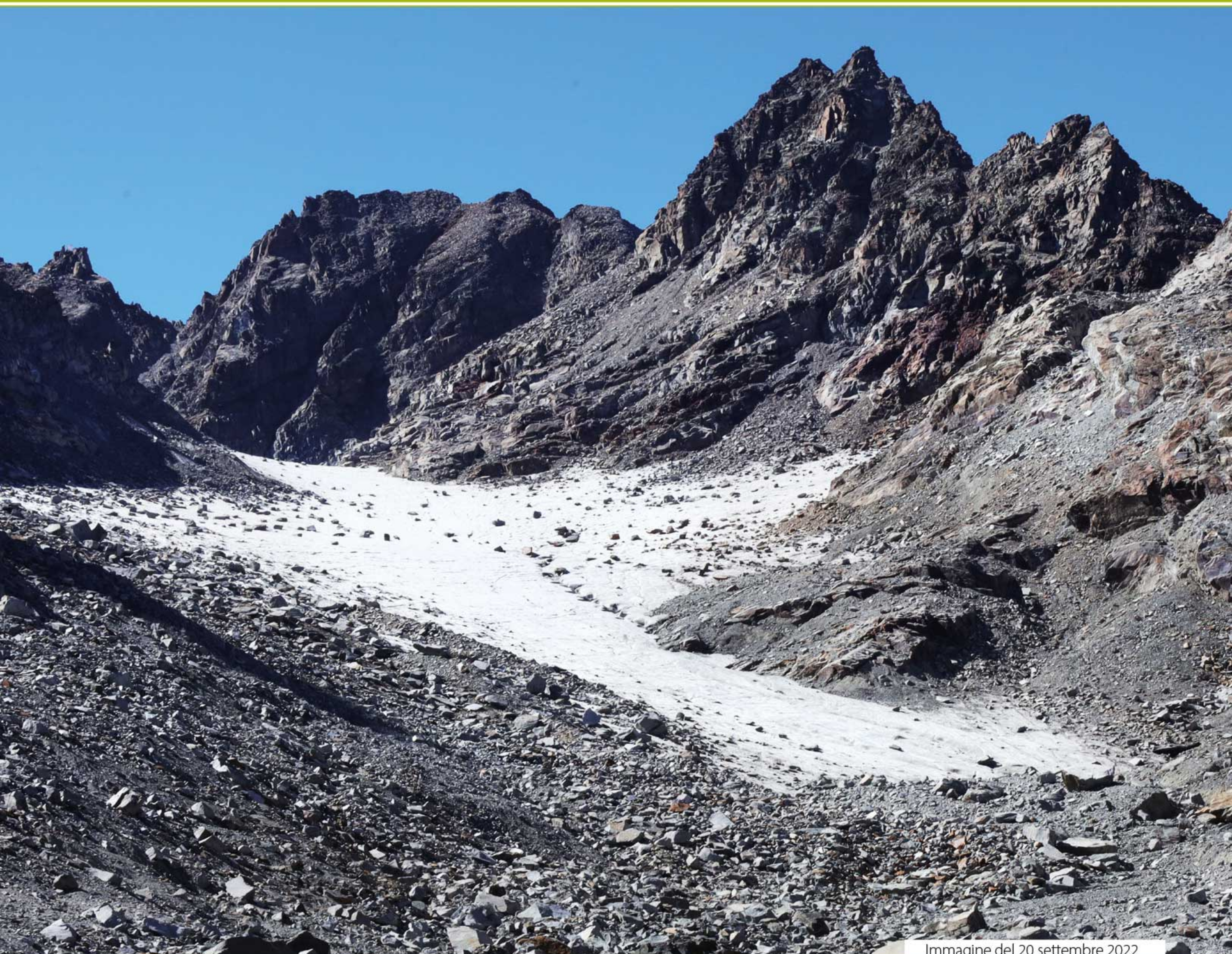
Immagine del 20 settembre 2022